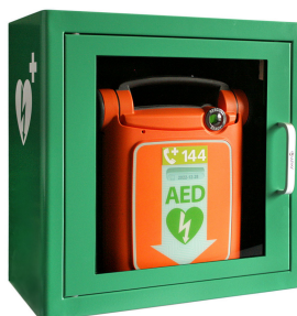
ZOLL Powerheart G5 avec ou sans sacoche