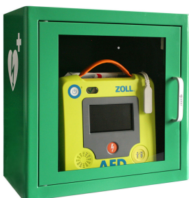
ZOLL AED 3 Sans sacoche