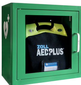
ZOLL AED Plus avec ou sans sacoche